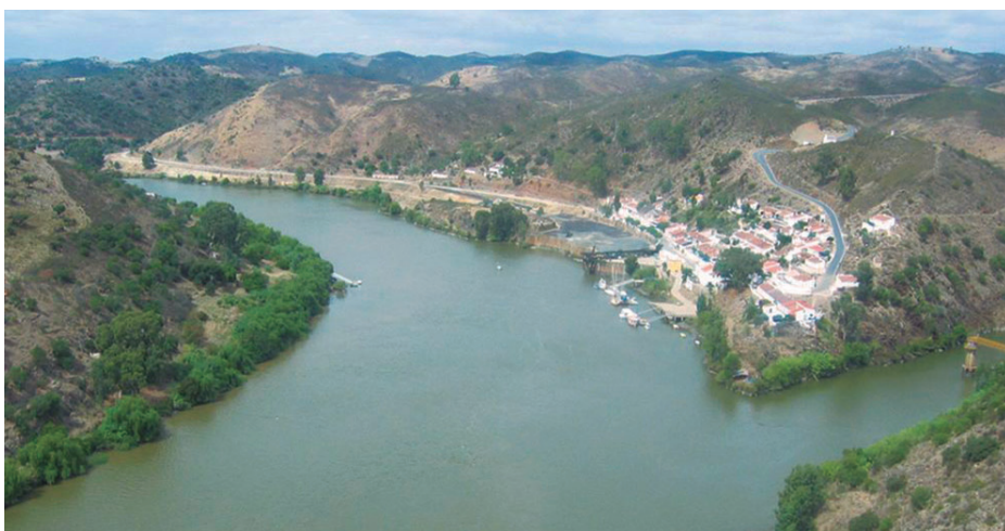
A captura de água na zona do Pomarão é o principal investimento na eficiência hídrica no âmbito do PRR

estão instaladas no terreno. Falamos de citrinos, vinho, estufas, abacates, romãzeiras, diospireiros, etc”, explica Pedro Monteiro.