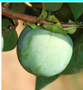
77 - Fruto (cerca de 70 % do tamanho final)