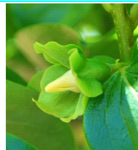
57 - Pétalas visíveis