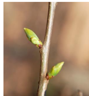
09 - Botão floral com cerca de 5 mm acima do gomo