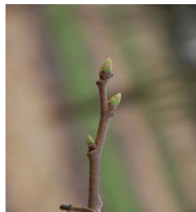
08 - Abertura do gomo