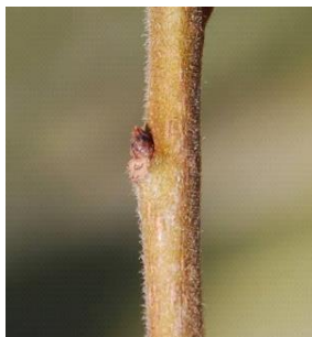
00 - Gomo dormente