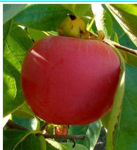
89 - Maturação total