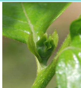
55 - Início da separação das sépalas