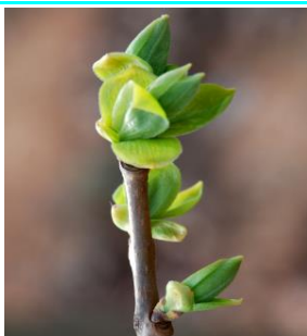
15 - Folhas separadas sem atingir o desenvolvimento total