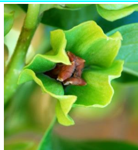
71 - Vingamento dos frutos