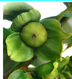
72 - Fruto (cerca de 20 % do tamanho total)