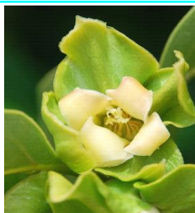
67 - Início da queda das pétalas