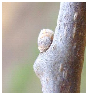
01 - Gomo inchado