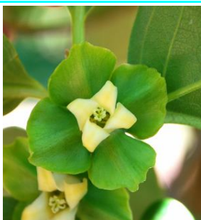
65 - Floração com mais de 50 % das flores abertas