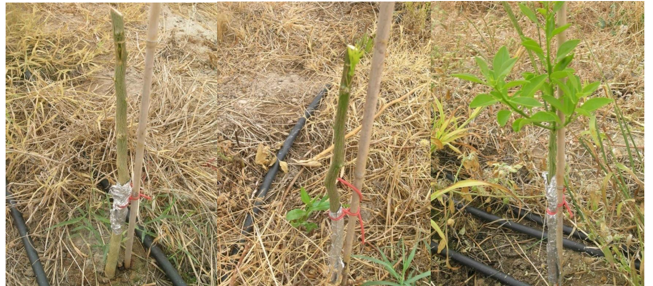
Evolução das enxertias