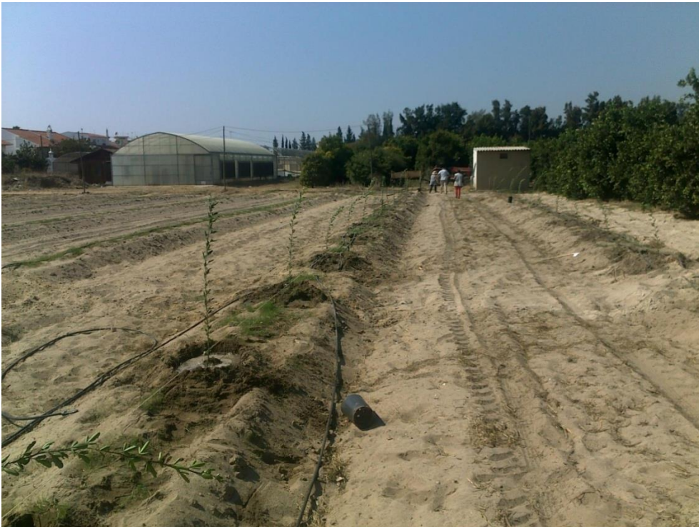
Plantação das citranjeiras