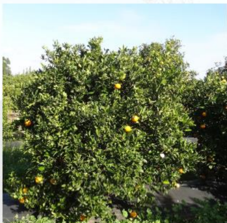
Laranjeira "Baía de Espanha" – 22C